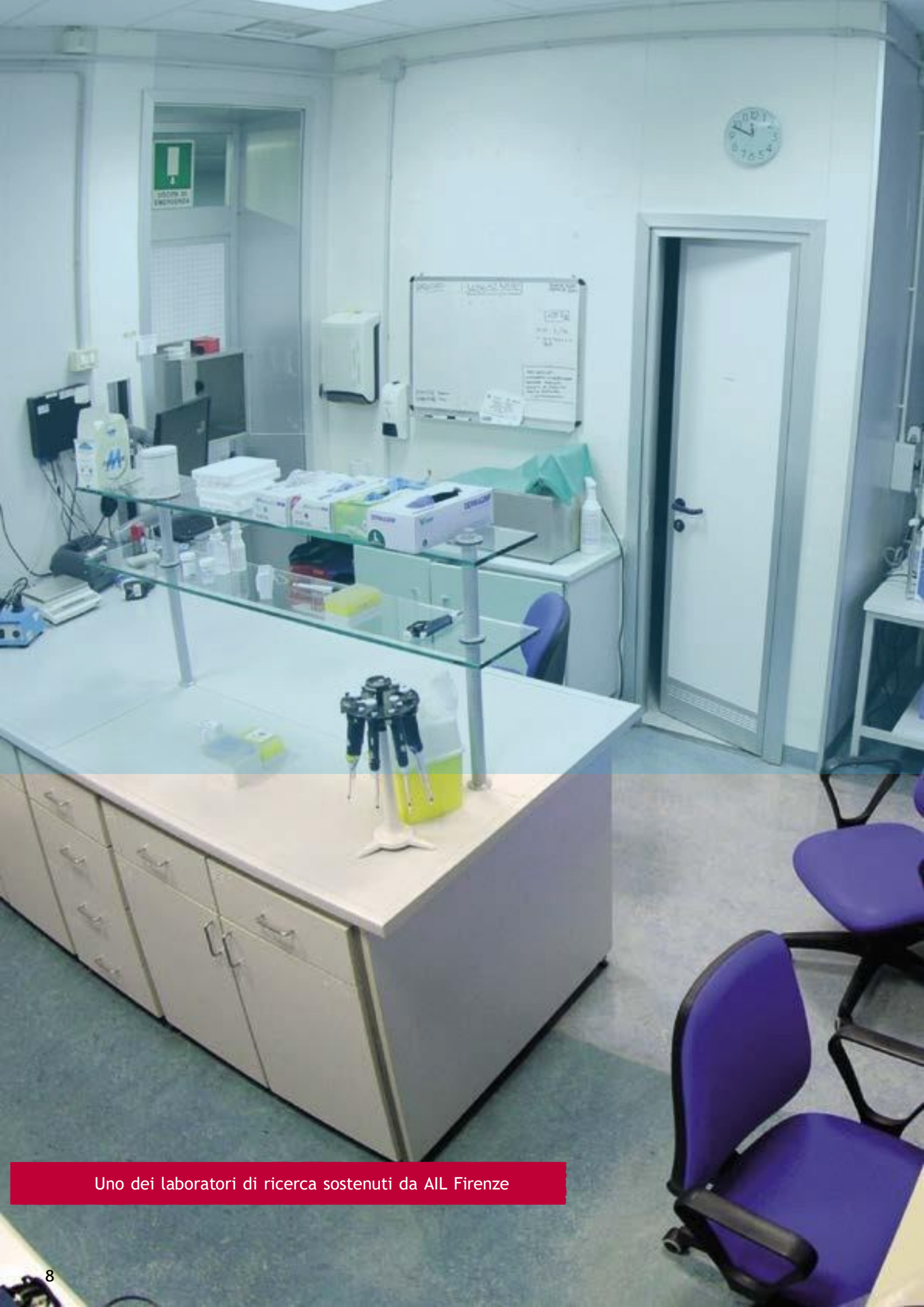
Uno dei laboratori di ricerca sostenuti da AIL Firenze